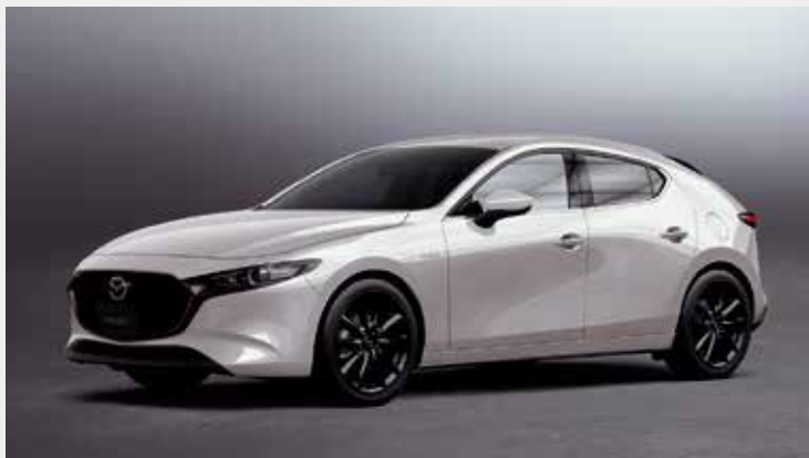
MAZDA3 FASTBACK X L-Package(2WD車) 新外板色「プラチナクォーツメタリック」

10月28日予約受付を開始し、11月下旬に発売を予定しています。今回の商品改良では、ダイナミクス・燃費・装備などの改良および新外板色の追加を行っています。また、機種ラインナップのリニューアルおよび特別仕様車の追加設定を行いました。ぜひ、現車をお近くの販売店で確かめください。