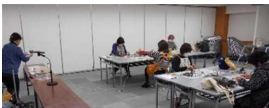
<3密を避けた会場・レイアウトで開催>