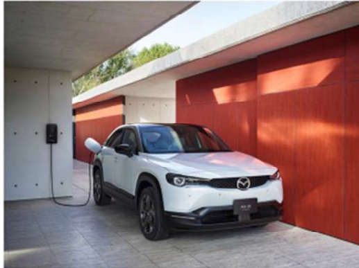
「MX-30 EV MODEL」EV Highest set

マツダ株式会社（以下、マツダ）は、「MAZDA MX-30 EV MODEL（エムエックス サーティ イーブイ モデル）」を、全国のマツダの販売店を通じて、1月28日に発売しました。