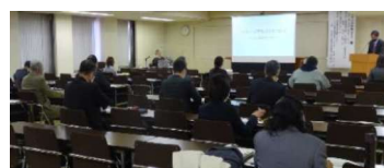
<セミナー受講風景>