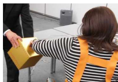
<厳正なる抽選風景>